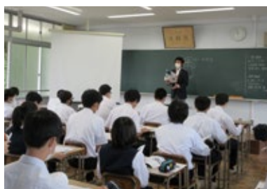
真和高等学校制度説明会