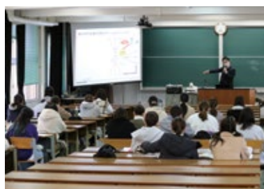
鹿児島県立短期大学制度説明会