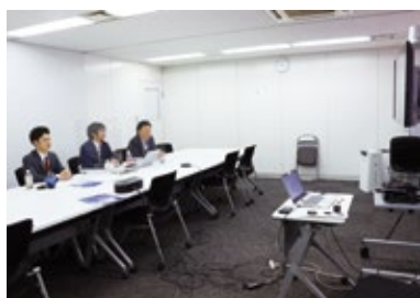
熊本学園大学制度説明会(オンライン)

南九州会では、高校・大学を訪問し、公認会計士制度や業務について紹介する制度説明会を例年各地で開催しています。当会会員が講師となり、協会パンフレット、DVD及びパワーポイント資料を基に、自身の志望動機や合格体験談、仕事のやりがい等について説明しています。2020年度は新型コロナウイルス対策を十分に行いながら、真和高等学校（熊本市）、宮崎県立宮崎南高等学校、大分県立大分上野丘高等学校の高等学校3校及び鹿児島国際大学、鹿児島県立短期大学、熊本学園大学の大学3校（いずれも九州財務局と共催）で制度説明会を開催しました。新型コロナウイルス感染拡大防止の観点から、鹿児島国際大学は事前収録した動画をYouTubeで配信し、熊本学園大学はZoomでのオンライン中継という新しいスタイルで開催しました。