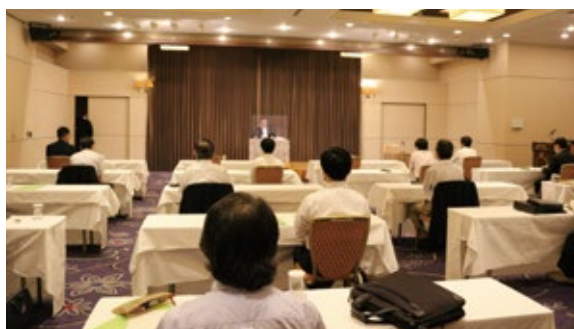
熊本国税不服審判所長による研修会

また、例年開催している熊本国税不服審判所長をお招きしての研修会は、コロナ禍の中でも感染防止対策を講じ、「国税不服審判所設立50周年を迎えて」というテーマでご講義いただきました。