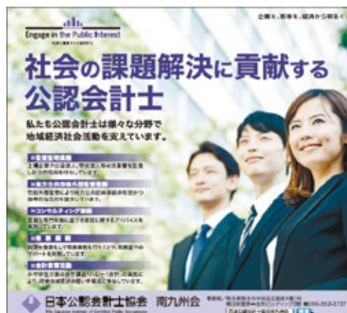
新聞広告「社会の課題解決に貢献する公認会計士」

例年、7月6日の「公認会計士の日」には南九州管内4県の地元紙に新聞広告を掲載しておりますが、2020年度は新型コロナウイルス感染拡大に伴い、時期を改めて、「社会の課題解決に貢献する公認会計士」というテーマで南九州4県の統一広告を掲載しました。